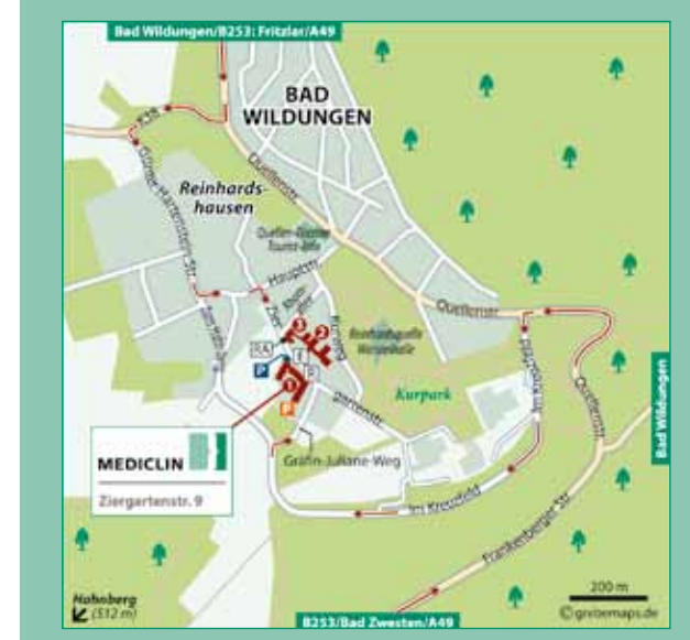
© MediClin, 07/2018; Satz und Layout: Tine Klußmann, www.TineK.net

Reha-Portal der MediClin www.mediclin-reha.de